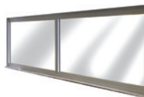
Châssis affleurant 1 face GR1