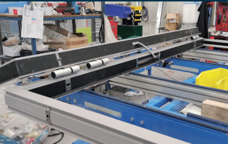
Porte E130 avec gâche électrique