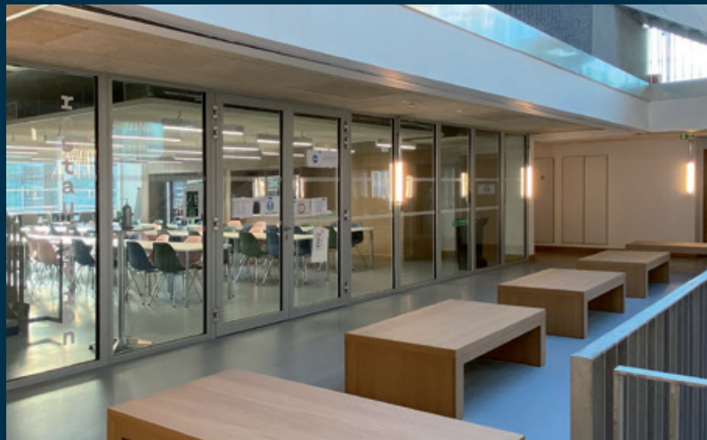
Ensemble vitré E160, centre universitaire PARIS