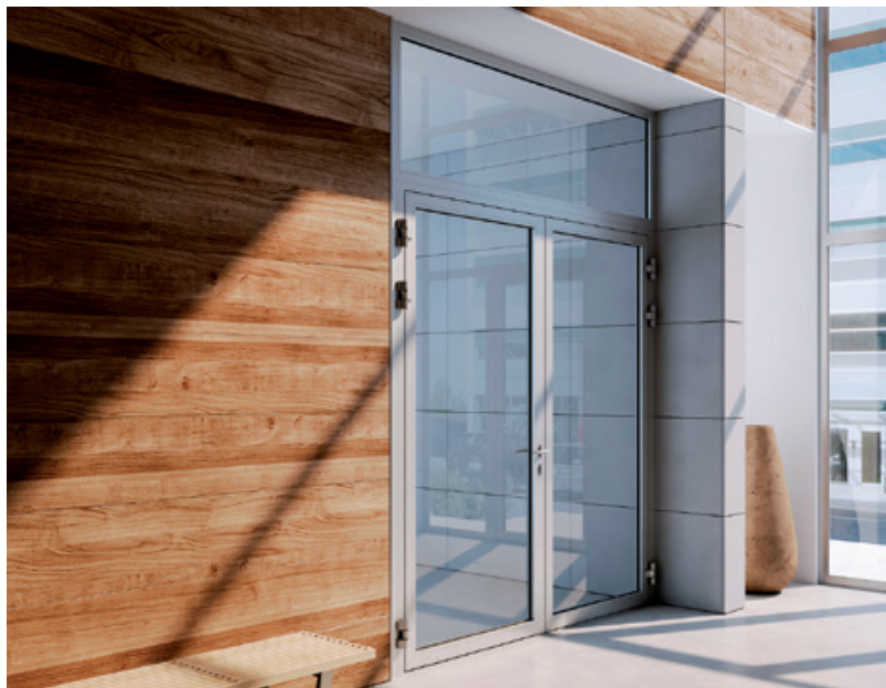
Porte 2 vantaux EI30 + imposte