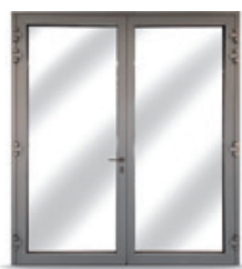
Bloc porte coupe-feu

6 semaines pour portes et châssis sur-mesure