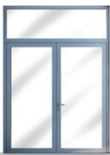
Bloc porte pare-flamme